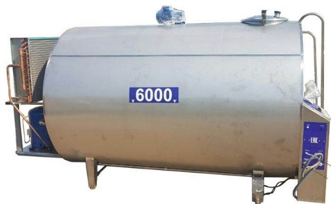
Охладитель молока закрытого типа собственного производства «Full tank-6000»

Согласно Вашего запроса, предлагаем рассмотреть цены и сроки поставки данного оборудования: