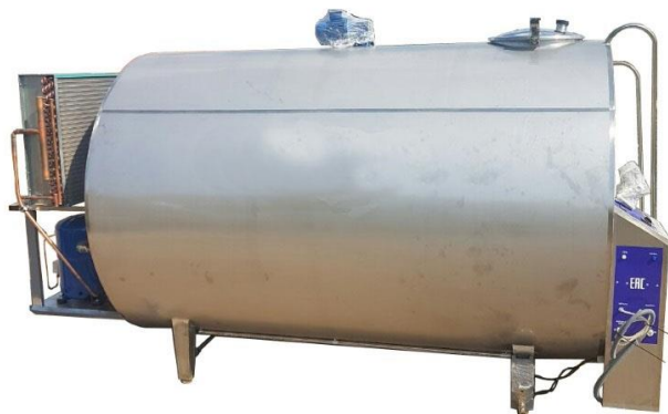
Охладитель молока закрытого типа собственного производства «Full tank-7000»

Согласно Вашего запроса, предлагаем рассмотреть цены и сроки поставки данного оборудования: